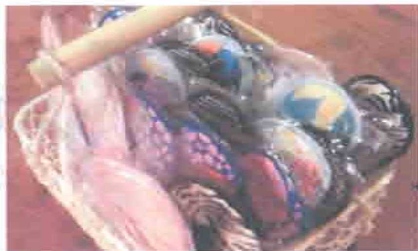
Sサイズ: ¥820、Mサイズ: ¥1480 (各一枚入り) から各種あります。

使い捨てと違ってゴミにならないうえ、敏感肌やひどい生理痛に悩む人からも支持されている「布ナプキン」。ネットショッピングでも人気上昇しているその秘密はどこにあるのでしょうか。