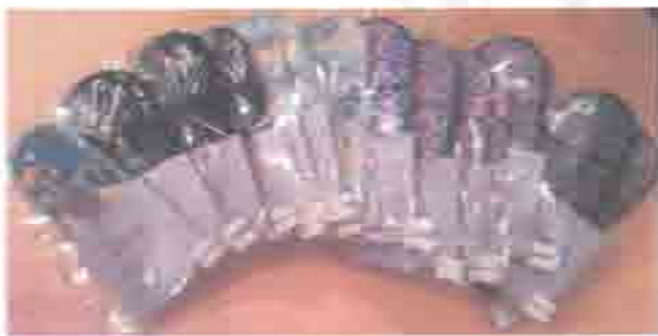
様々なデザインが楽しめるのも布ナプキンならでは。

最初購入する際の金額は高いのですが、石油製品である紙ナプキンに比べ、肌に優しく、感染症も激減す