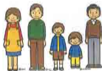
おじいさんと息子さん夫婦、 お子さん二人の 三世代住宅です。