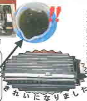
きれいになりました

エアコンはフィルタを掃除しても、その奥にも汚れは溜まっています。洗淨するとこんなに真っ黒になった水が溢れてきます。クリーニングしたエアコンからはきれいな空気がでてきますよ!