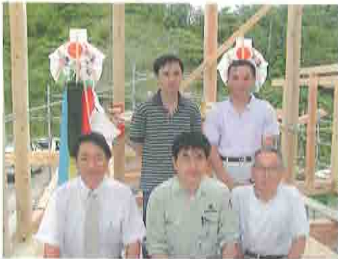
みんな一緒に記念撮影