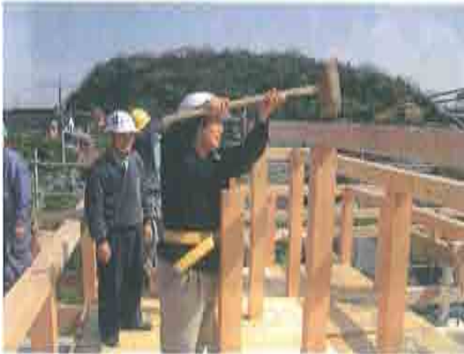
当社では記念にお客様の手で棟をたたいて頂いております！