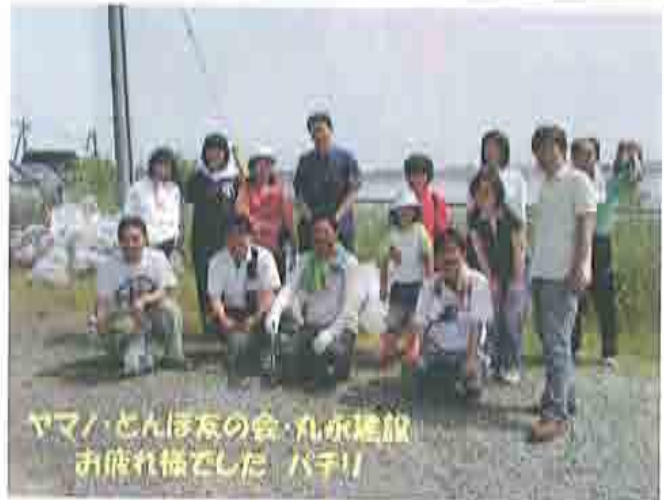
ヤマノ・とんぼの会・丸永建設 お疲れ様でした パチ！！

鳥取県ジュニアヨットスクールの子供達が中海クリーンクラブとして2002年より中海護岸清掃を始めました。